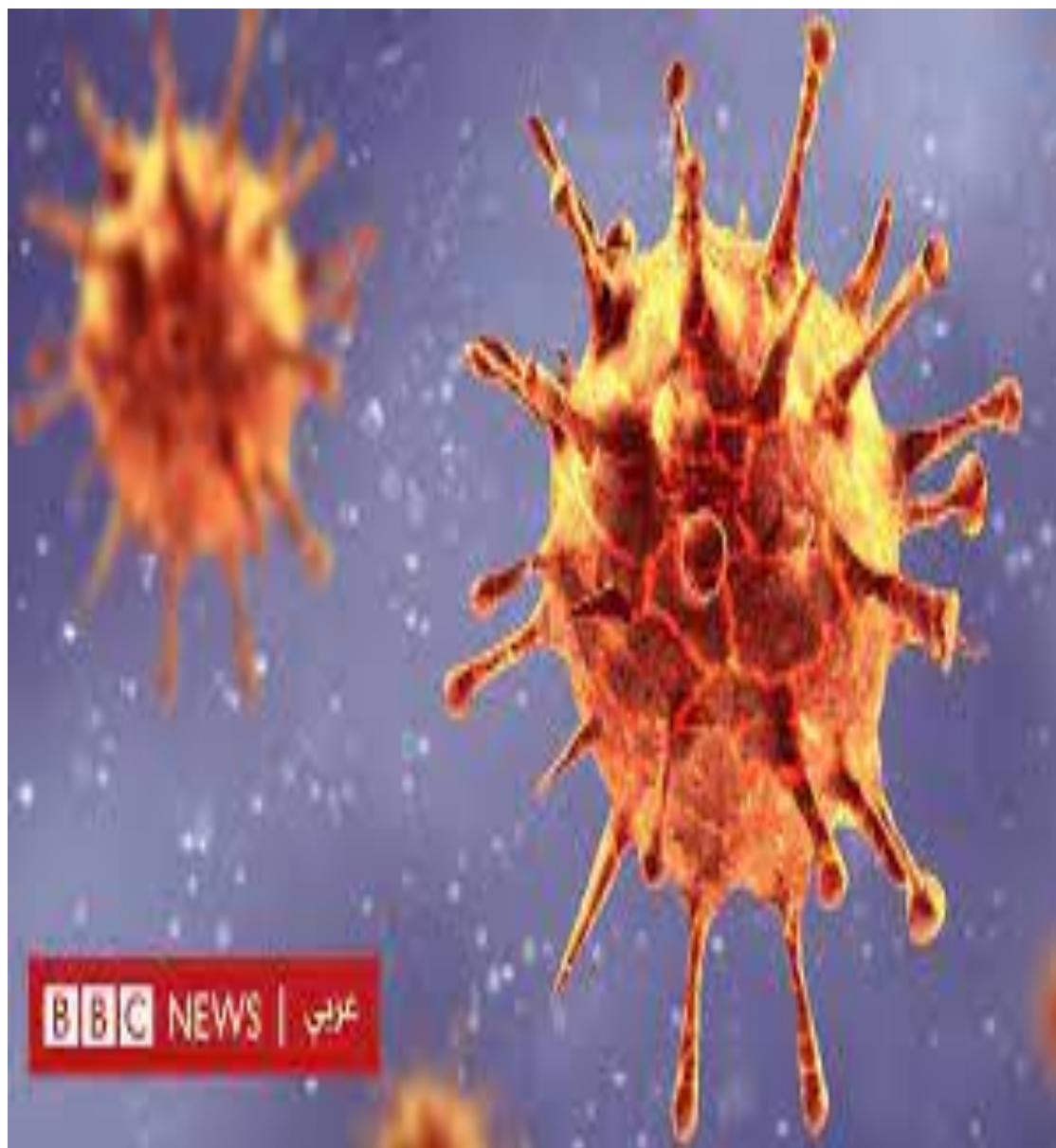
شكل رقم 1: فيروس كورونا