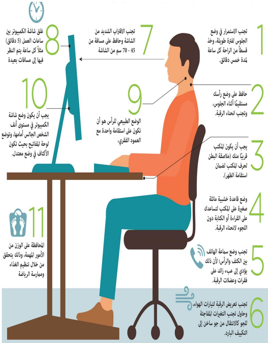
شكل رقم 7: كيفية الجلوس الصحيح أمام شاشات الكمبيوتر