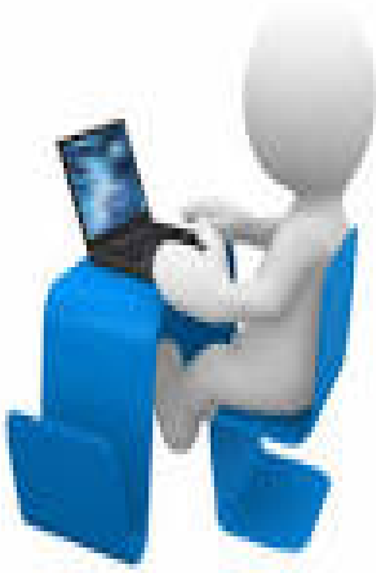
شكل رقم 4 : التعليم عن بعد