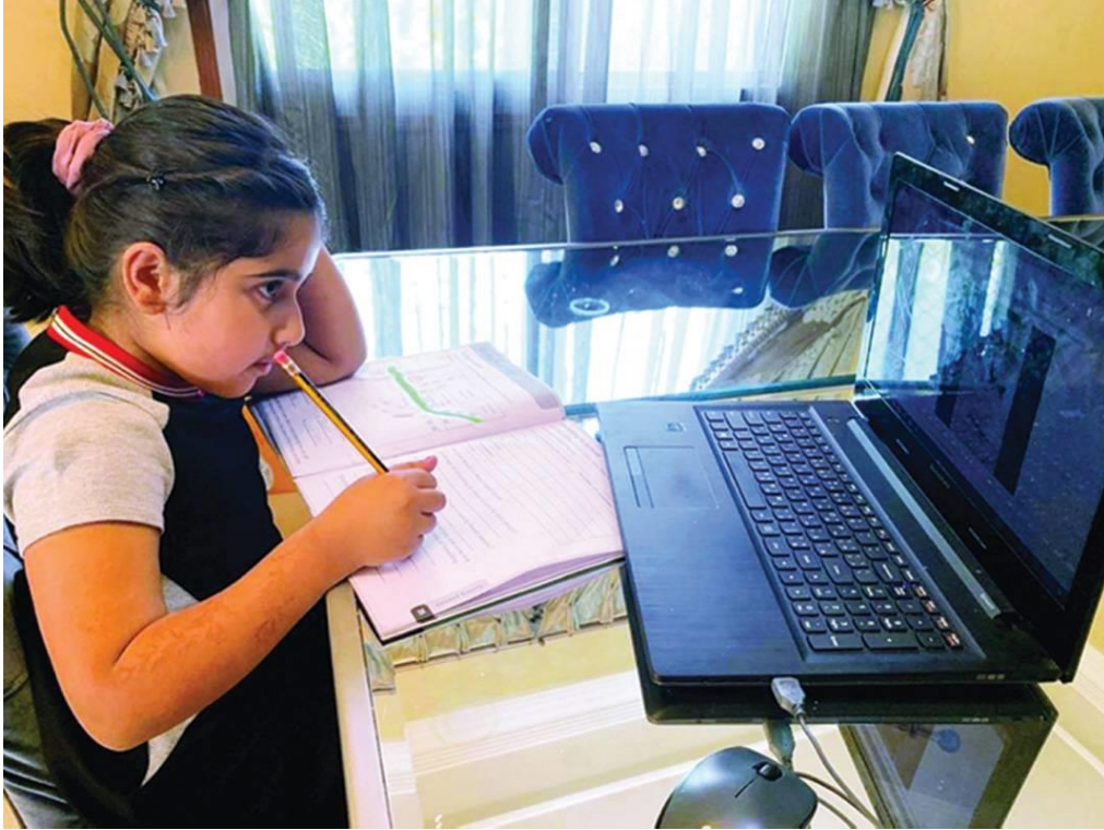
شكل رقم 6 : أهمية دور الأهل في مراقبة الأبناء أثناء التعليم عن بعد

13- الأوقات أو عدد الساعات المسموحة صحياً للتعليم عن بعد للصغار والكبار: الوقت المسموح به للجلوس أمام الشاشة (التلفاز أو الأجهزة الإلكترونية توصي الأكاديمية الأمريكية لطب الأطفال بالتالي:(جدول رقم 2)