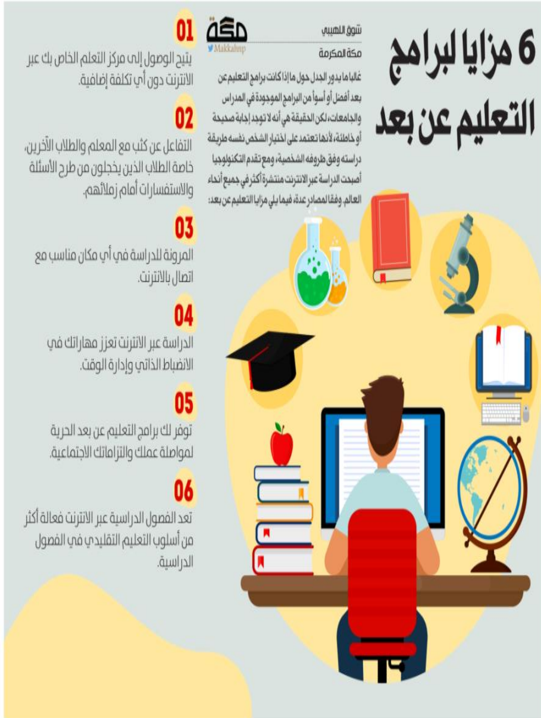
شكل رقم 5 الفوائد المكتسبة من التعليم عن بعد